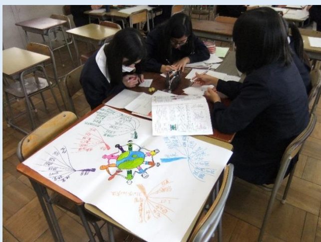
〈マインドマップを描いている様子〉

テーマが決まったグループからリサーチクエストをより深く考えられるようマインドマップ作成し、アンケートやインタビュー、文献などさまざまな調査方法を考え、研究活動の進め方について議論しました。