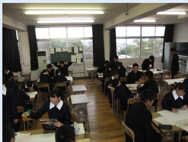
〈グループで議論している様子〉