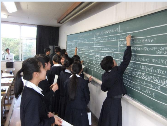
〈生徒がリサーチクエストを板書している様子〉

11月から教育コースの生徒たちはグループ課題研究活動（通称：ERP）を始めました。まずは、リサーチクエストを通してテーマ設定を行い、テーマに関する資料を読み、キーワードを挙げ、インターネットを活用して情報の整理を進めました。