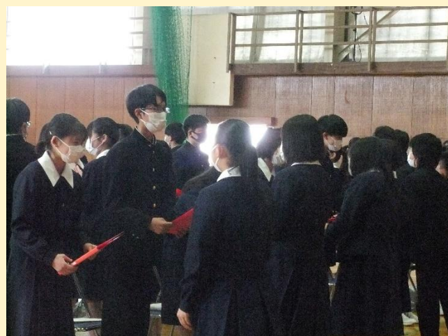
＜ 先輩からメッセージカードを送る ＞