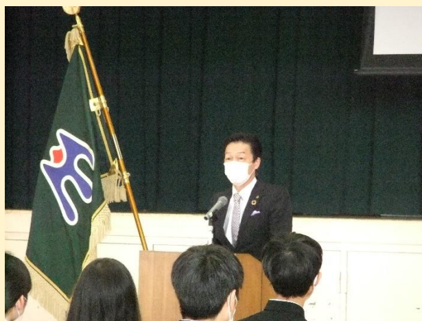
＜ 山西正泰教育長 ご祝辞 ＞