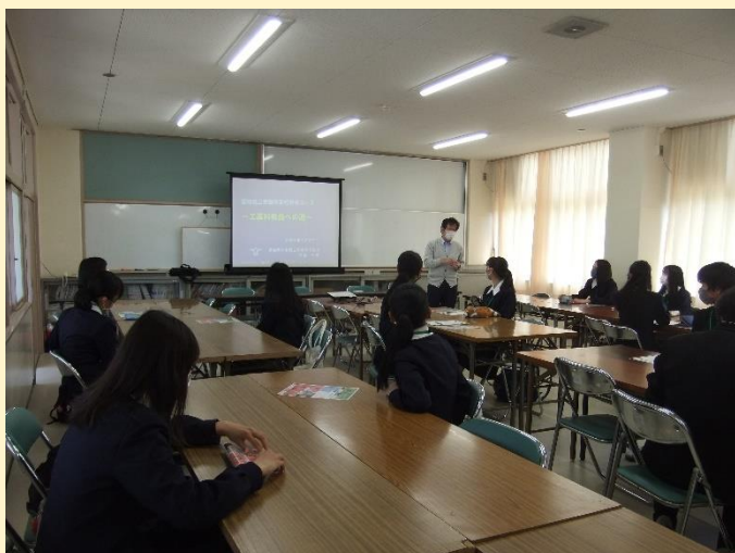
＜ 学校説明 豊橋工科 ＞