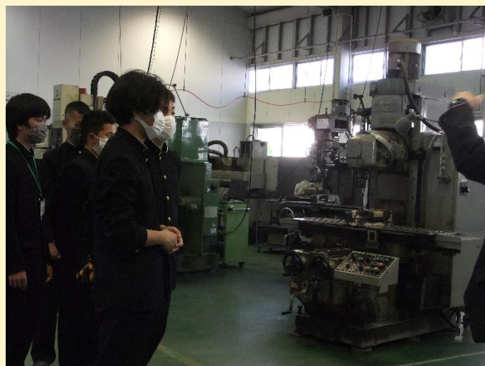
＜ 授業で使用される機械の説明 豊橋工科 ＞