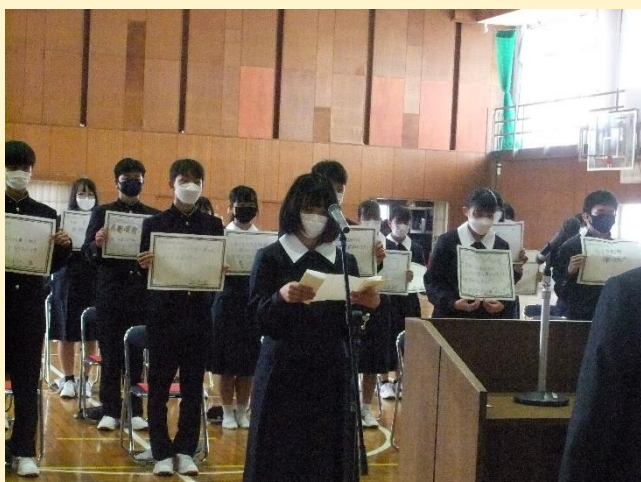
＜ 新入生代表 あいさつ ＞