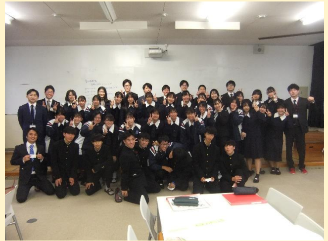
【 みんなで記念撮影 】