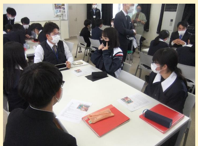
【 大学院生とのアイスブレイク(自己紹介) 】