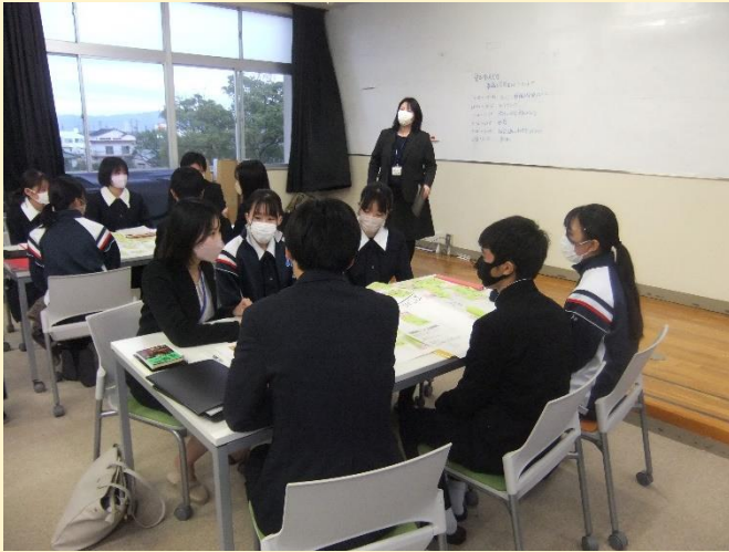
【 鯉江美穂先生より御講評 】