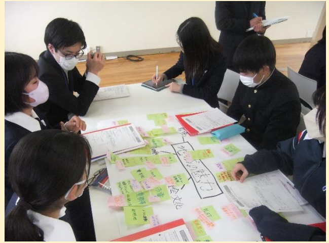
【 教育コース生による探究活動紹介 】