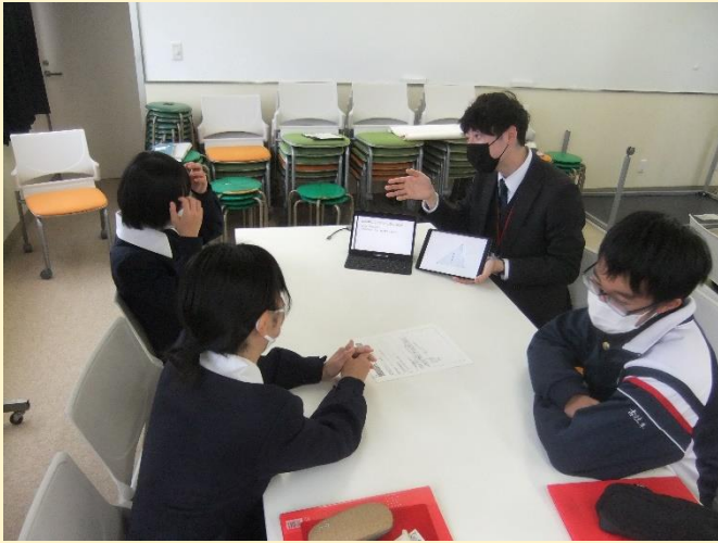
【 教職大学院生の研究紹介 】