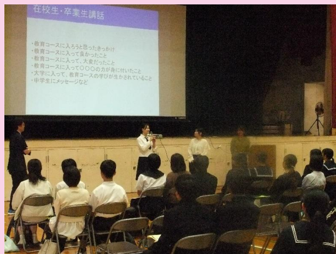
【在校生・卒業生講話(全体説明会)】