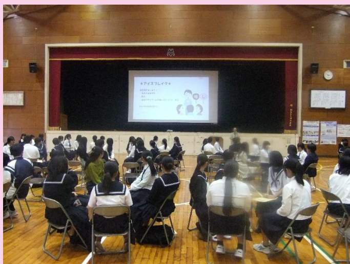
【在校生と一緒に授業体験】