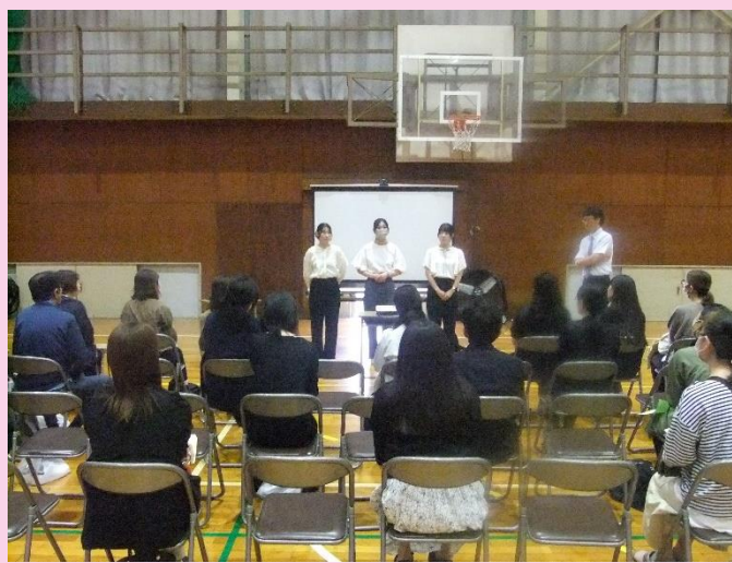
【卒業生講話(保護者説明会)】